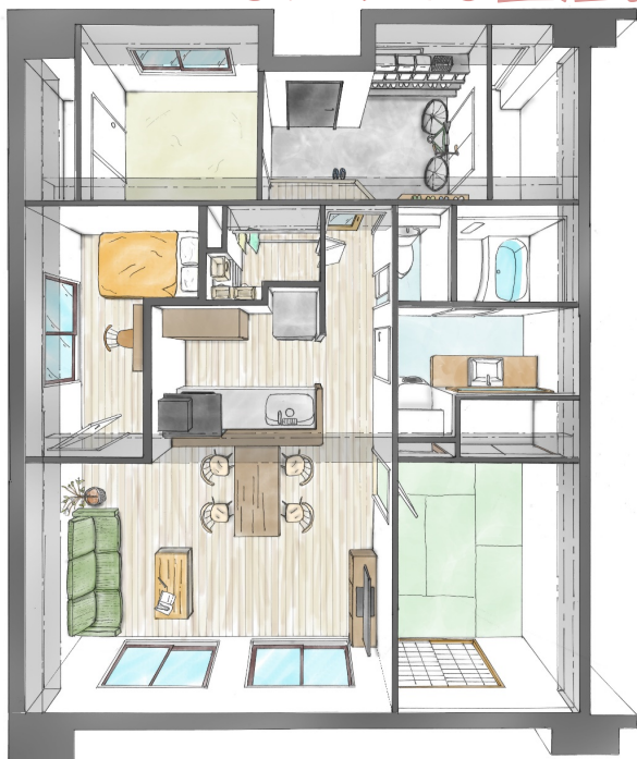
※イラストの家具家電はイメージです。