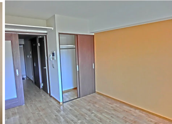
※部屋毎にアクセントクロスの色が異なります。